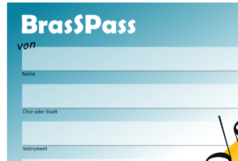
Der neue BrasSPass - Seite 11