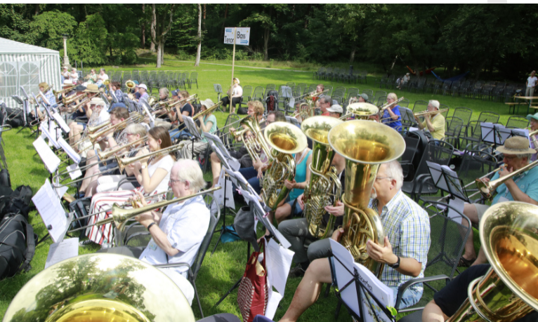
Jemand soll gesagt haben, die tiefen Stimmen seien schöner!