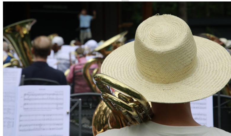
Die Besucher der Matinee hatten einen guten Ausblick