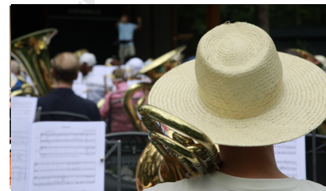
Bläserfest 2023 - Seite 8