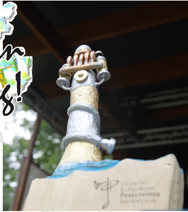
Der Leuchtturm vom DEPT wurde offiziell übergeben