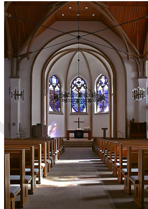
Bartholomäuskirche Brackwede