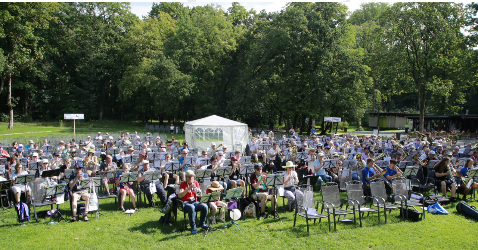
250 Bläserinnen und Bläser aus ganz Westfalen auf der Adlerwiese - wir und alle Besucher hatten einen tollen Tag!