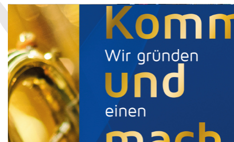
Gründung von Posaunenchores - Seite 12