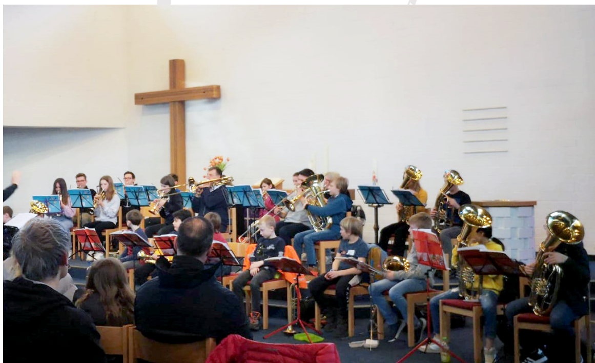
Kleine Abschlussmusik in der Erlöserkirche

Wie sieht die Zukunft der Posaunenchöre aus? Fragen, mit denen wir uns beschäftigen müssen!