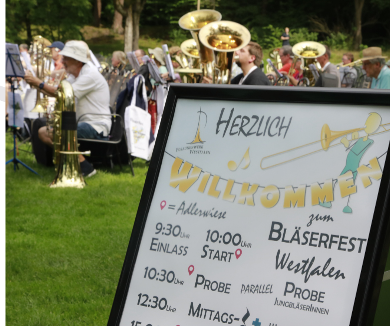
Ein abwechslungsreiches Programm

Vielen Dank an alle, die diesen Tag vorbereitet haben – und an die, die ihn mit gestaltet haben. Sie alle haben den Daheim-Geblienen viel zu erzählen.