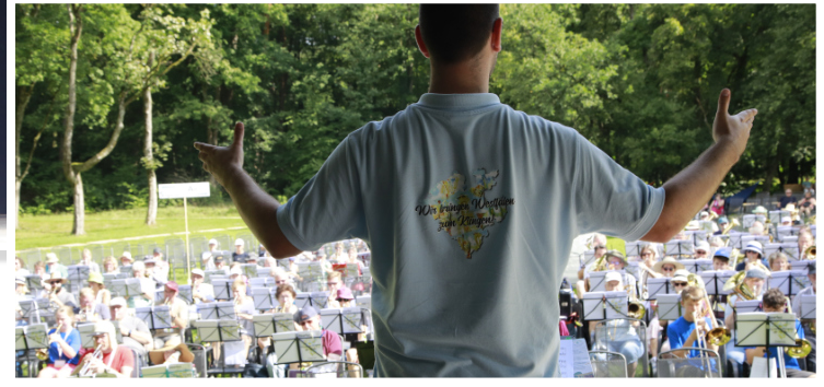
Beide LPWs führten uns mit Freude durch das Programm