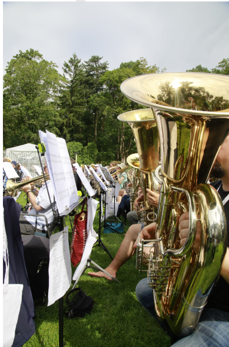
Was eine Pracht...schöner als ein Kirchenfenster!

eigentlich die Leute, denen ihr so begegnet, über mich? Wer, denken die, bin ich?“