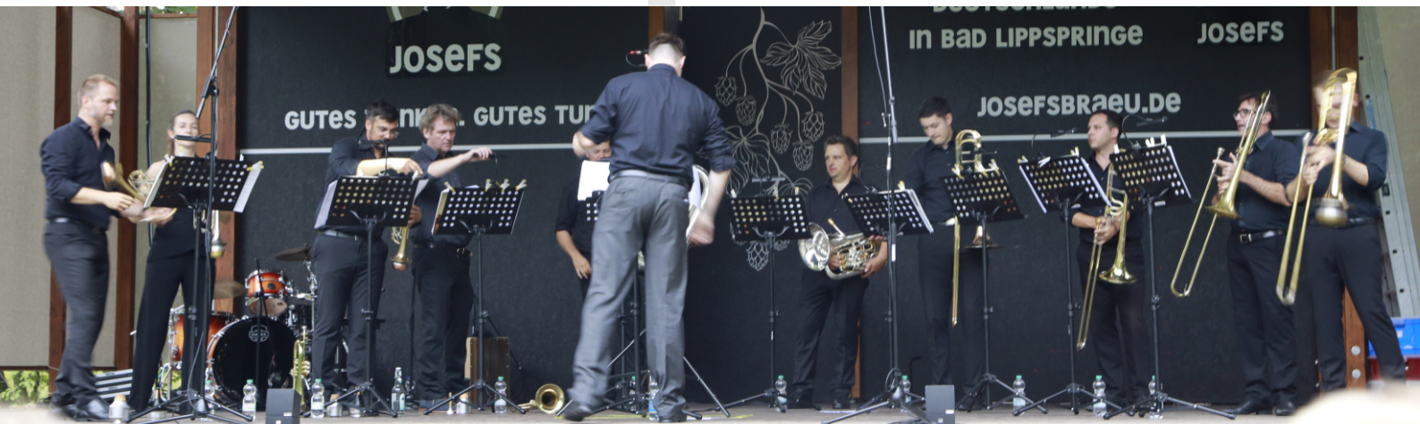
Das Konzert von Genesis Brass war ein wundervolles Dankeschön an alle Bläserinnen und Bläser!