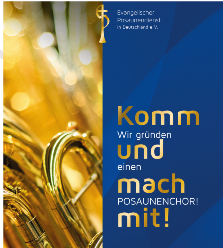
Ausschnitt vom Musterplakat zur freien Verwendung im download

Aber, nicht verzweifeln, da gibt es jetzt seit Neustem eine sehr gute und kompetente Hilfe auf der EPiD Seite unter dem Stichwort: Gründung von Posaunenchoeren. Hier erhaltet ihr alle Hilfen, die ihr zur Gründung eines Chores braucht. Es gibt Hilfestellungen, alle Fragen werden beantwortet und es gibt hilfreiche downloads, die euch weiterbringen. Schaut einmal rein und lasst euch inspirieren und anspornen. Ich wünsche euch dabei Gottes Segen und viel Glück.