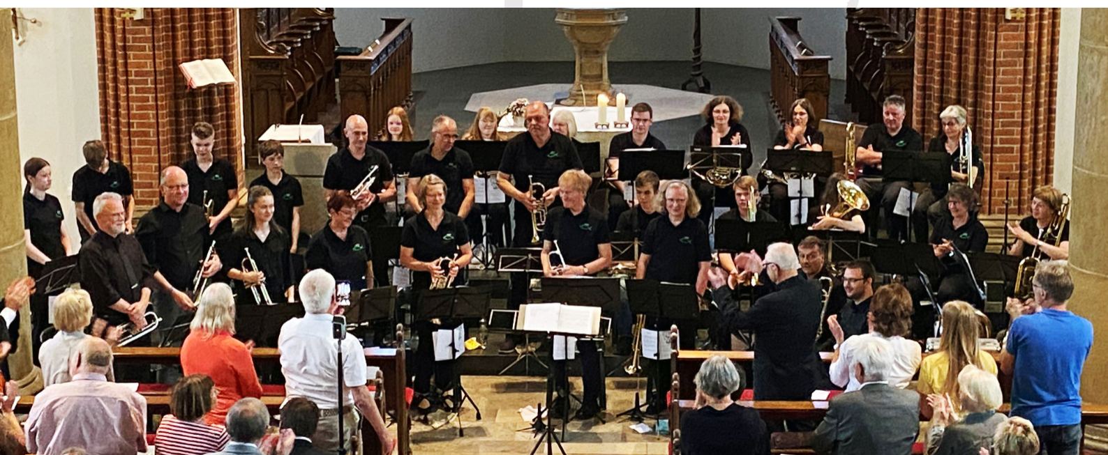
Standing Ovationen der Zuhörer für die 30 Musiker

In der musikalischen Sommer-Andacht ertönte fröhlich-sommerliche Musik zum Lobe Gottes. Trompeten, Waldhörner, Posaunen, Euphonien und Tuba vereinten sich zu klangvollen sommerleichten Melodien und erfüllten das große Kirchenschiff.